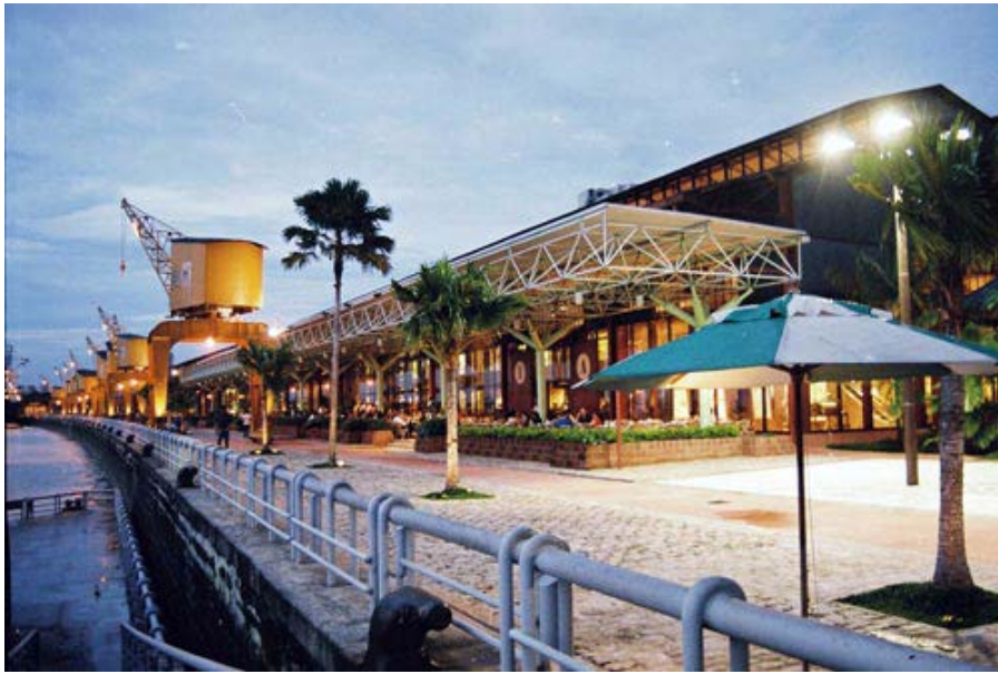
Figura 11. Estação das Docas, Belem do Pará.