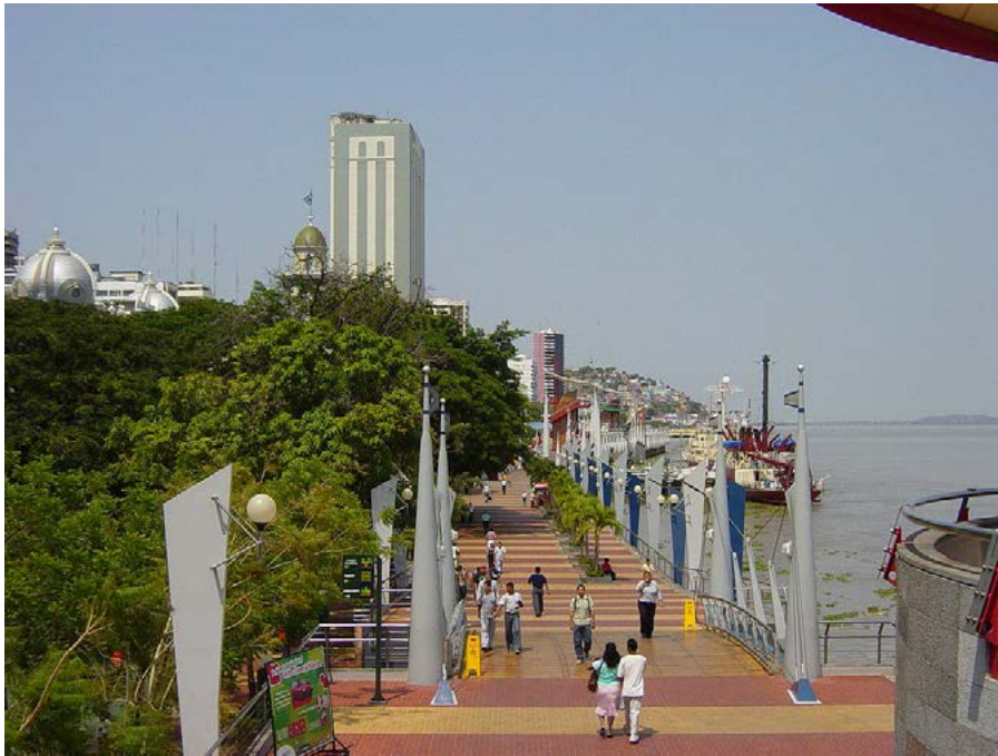
Figura 10. Malecón 2000, Guayaquil.

éxito obtenido ha llevado a extender la rehabilitación y transformación de otros lugares de la ciudad, como el Malecón Estero Salado y el Malecón Vicente Rocafuerte, gestionados por la misma Fundación. El proyecto, las obras y el desarrollo del Malecón 2000 son un ejemplo de las posibilidades de transformación de viejos espacios portuarios y de su impacto positivo en la ciudad cuando hay una voluntad de mejora y una gestión eficiente de los recursos.