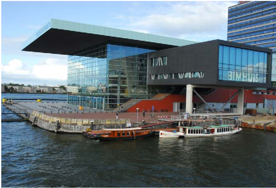
Figura 3. Teatro y terminal de cruceros en Copenhague.

Estados Unidos, Canadá y Asia situadas en la costa marítima, en ríos o en grandes lagos, se han realizado o se encuentran en proyecto grandes operaciones urbanísticas e inmobiliarias que están cambiando profundamente sus frentes de agua. Pero aunque estas operaciones puedan parecer similares a las reconversiones portuarias son muy distintas por su situación, por el patrimonio histórico de las infraestructuras marítimas, por la base física sobre las que se asientan y por la huella urbana y cultural que siempre han dejado los viejos puertos.