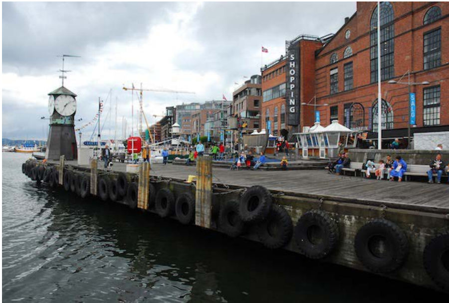
Figura 4. Muelle de Aker Brige de Oslo.

ruido o incluso seguridad para las áreas urbanas provocados por el incremento de las actividades de carga-descarga y entrada-salida de mercancías. También la crisis industrial de los años setenta y ochenta del siglo XX en los países más desarrollados dejaba espacios libres en algunos de sus puertos (Marshall, 2001). Los puertos construían nuevos muelles para los tráficos de aquel momento y de los próximos años lejos del centro urbano, según un modelo de abandono de viejos espacios y conquista de nuevas áreas (Bird, 1971; Hoyle, 1988). Todos estos elementos, junto al atractivo que ofrecían los puertos con su patrimonio técnico y arquitectónico, la oportunidad que se vislumbraba de una nueva relación directa de la ciudad con el agua, y por otra parte, las grandes posibilidades que presentaban estas amplias áreas cercanas al centro urbano, fueron los factores que impulsaron la mayor parte de los proyectos de reconversión y revitalización de los viejos y obsoletos muelles (Bruttomesso, 1991).