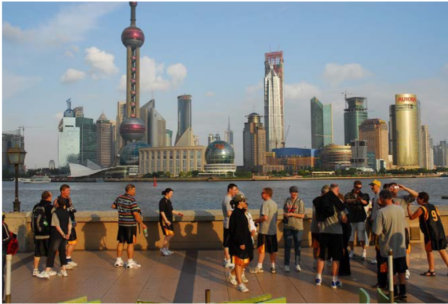
Figura 7. Pudong desde el paseo The Bund, Shanghai.

En algunas transformaciones portuarias se han menospreciado las actividades marítimas dejando vacías o muy poco ocupadas las dársenas y las superficies de agua. Allí donde antes había barcos, marineros, estibadores, comerciantes y agentes marítimos en plena actividad, llenando los muelles de vida y dinamismo, después de un proyecto inadecuado no hay nada, solo el espejo de agua. Ello produce una sensación de soledad y vacío. No hay espacios más tristes y desaprovechados desde un punto de vista socioeconómico, social y cultural que un viejo puerto sin embarcaciones ni personas trabajando. En todos los muelles y dársenas de un viejo puerto puede y debe haber actividades marítimas pero, ahora sí, compatibles con el uso urbano de los nuevos espacios públicos. El concepto se ha expuesto de forma clara: mantener el puerto en la ciudad . Ello no solo es compatible con la transformación del viejo espacio portuario sino que en la mayor parte de casos es una condición de su éxito y del pleno aprovechamiento social del muelle y las dársenas.