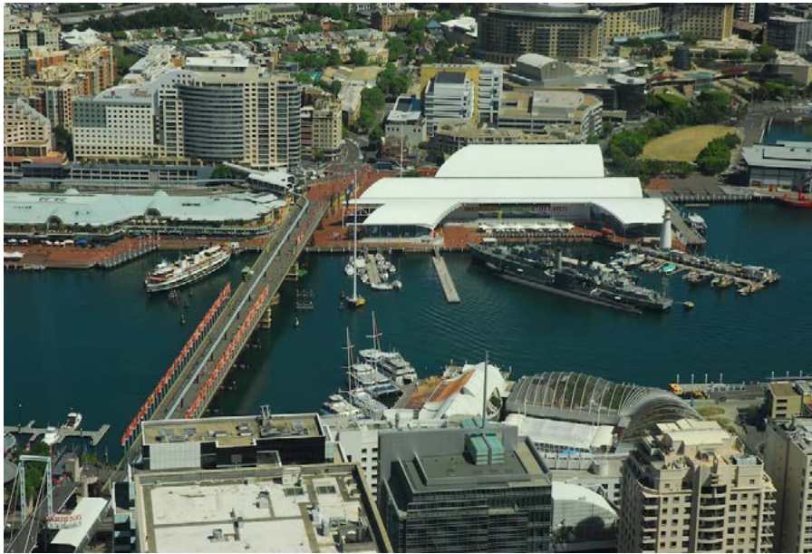
Figura 5. Museo Marítimo en Darling Harbour, Sídney.

una gran aceptación por parte de ciudadanos y visitantes, de académicos y cronistas urbanos, de inversores privados y responsables de equipamientos públicos.