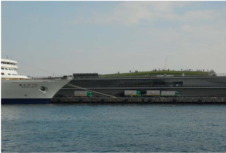
Figura 6. Terminal de cruceros con espacio público en la cubierta, Minato Mirai, Yokohama.

Las reconversiones portuarias más exitosas desde un punto de vista social serían las que presentan más demanda social y las que han creado y mantenido mayor número de puestos de trabajo. El primer supuesto puede conseguirse con una mezcla de usos y actividades que mantenga una elevada demanda durante todo el día, todos los días de la semana y todos los meses del año. En este sentido los equipamientos y servicios deben dirigirse a tres tipos de demanda: a) demanda local , de la propia ciudad y especialmente de los barrios más próximos, que asegura unos usos básicos de carácter cultural, comercial y de ocio (museos y centros culturales, tiendas, actividades náuticas, restaurantes y bares) para los ciudadanos residentes; b) demanda regional de visitantes de áreas próximas a la ciudad (delimitadas en una isócrona de dos horas, por ejemplo) que usa los mismos servicios que los residentes, pero a diferencia de estos visita la mayor parte de equipamientos públicos y privados. Es una demanda de personas que han viajado expresamente para conocer estos espacios y cuya visita, por tanto, se prolonga a lo largo de un día; c) demanda internacional de visitantes externos al país que visitan la ciudad (turismo urbano y viajes profesionales y de negocios) que encuentran en las áreas portuarias reconvertidas unos espacios públicos, equipamientos, servicios y actividades interesantes y atractivas.