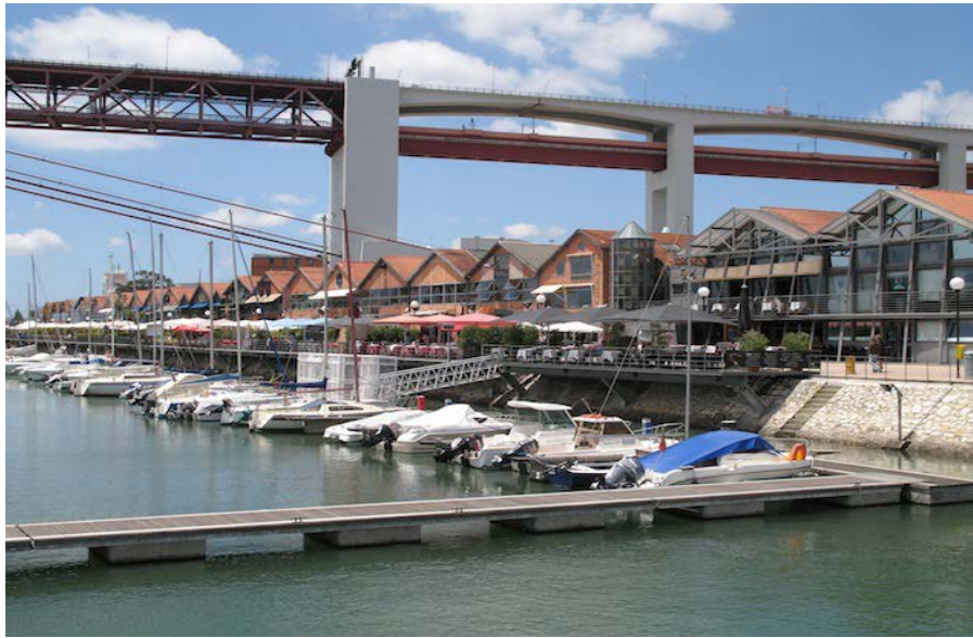
Figura 2. Docas de Alcántara de Lisboa.