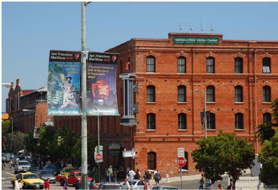
Figura 1. Nuevos usos para viejos edificios cercanos al puerto de San Francisco.

Pier , conformando en el norte una larga fachada marítima renovada. Después de estos primeros proyectos el proceso de revitalización del frente portuario fue continuando hasta alcanzar una larga extensión del espacio de contacto ciudad-puerto. Actualmente desde The Embarcadero hasta Fort Mason se encuentra una sucesión de espacios de contacto con el agua abiertos a la ciudad junto a actividades portuarias compatibles con el uso urbano como las terminales de ferris y cruceros, además de las embarcaciones de paseo por la bahía y barcos de pesca. La gran aceptación popular y el éxito comercial de los primeros proyectos tuvieron inmediatamente una incidencia positiva en áreas urbanas adyacentes produciéndose una recualificación de zonas próximas como Ghirardelli Square, ampliando y profundizando hacia el interior de la ciudad –al menos hasta Jefferson Street y Beach Street– la renovación urbanística de aquel largo frente marítimo. Hoy el proceso de transformación del viejo puerto de San Francisco es una experiencia emblemática y continúa proyectándose hacia el futuro, impulsado y regulado por un innovador e interesante Waterfront Land Use Plan ( www.sf-port.org ).