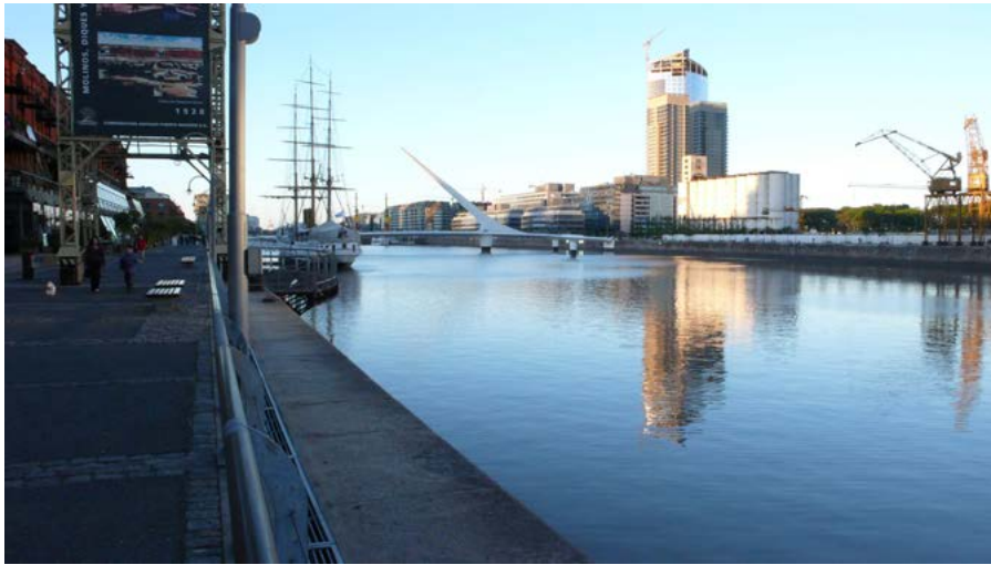
Figura 9. Puerto Madero, Buenos Aires.